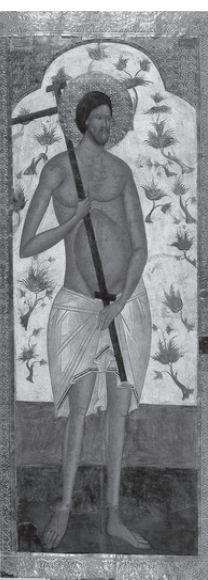
Икона "Благоразумный разбойник"