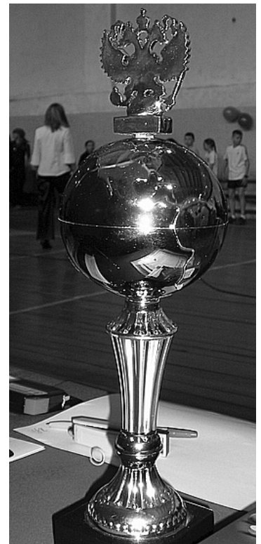
Кубок победителя достался детям сотрудников из Управления по конвоированию

Военно-спортивный конкурс тоже состоял из нескольких этапов. Ребята состязались в стрельбе из мелкокалиберной винтовки, в командном беге, а так же в метании гранат на дальность. Помимо этого, мальчики подтягивались на турниках, а девочки отжимались от пола. Военно-спортивный конкурс завершила