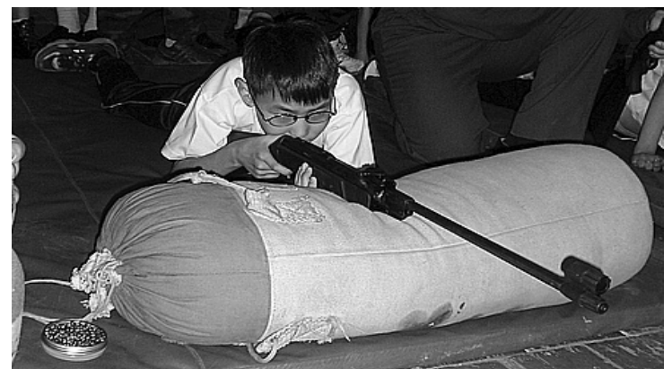
Юный страж закона должен попадать в яблочко!

игровая эстафета, где ребята со старанием и азартом старались опередить друг друга.