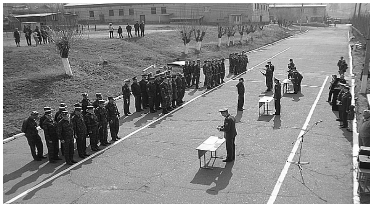
8 мая присягу приняли 32 сотрудника уголовно-исполнительной системы Забайкалья