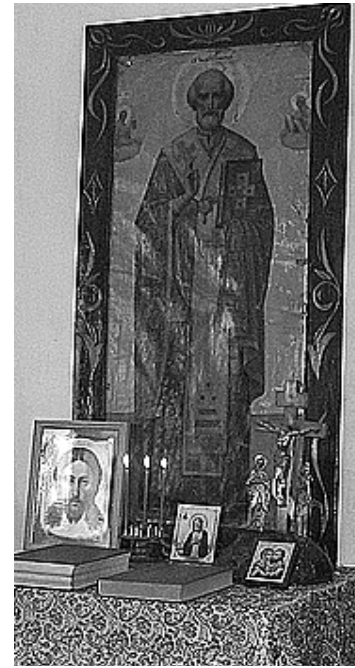
Икона Николая Чудотворца