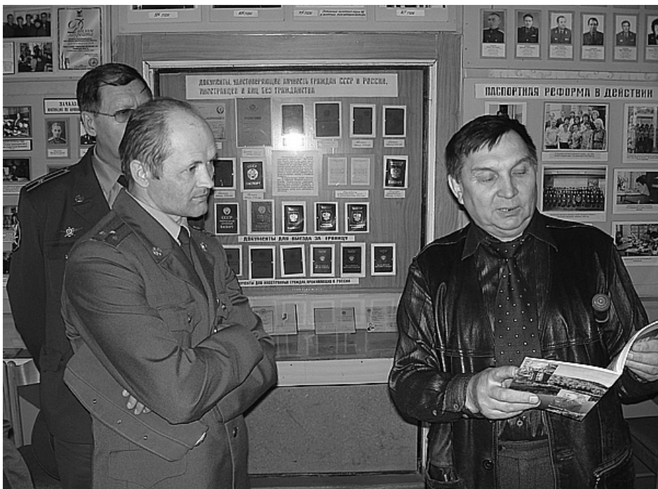
В Музее истории Забайкальской милиции

ным подходом к делу вы заслужили к себе такое отношение.