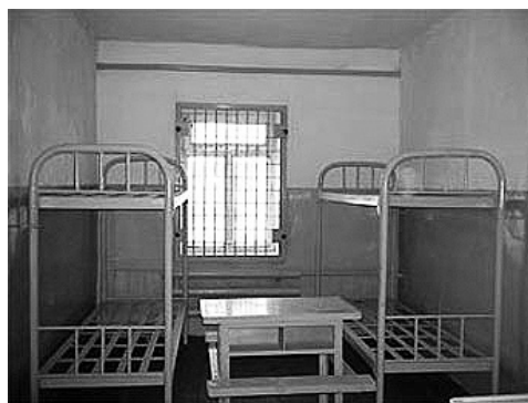
Реформа УИС позволила сделать отбывание наказания более комфортным.

Я поехал без ведома главка тайным поручителем в Москву на встречу с Калининским. Ездил я от Читинской области и Бурятии с целью узнать, что ждет от этой реформы. Юрий Иванович был очень занят, но нашел время для нашей беседы, представив все существующие на тот момент планы, наработки, документы, касающиеся грядущей реформы. Тогда я с уверенностью прилетел в Улан-Удэ, убедив личный состав в том, что бояться здесь нечего. В Чите было проведено совещание с начальниками колоний, на котором со всем доводами и аргументами было заверено, что хуже после реформы не будет. В этой ситуации больше плюсов, взяв хотя бы то, что зависит от МВД наша система уже не будет. В итоге — не ушел ни один сотрудник. Мы сохранились всем личным составом и перешли в Минюст. Потом постепенно у нас стали созда-