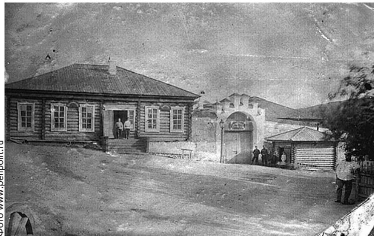
Въезд в Мальцевскую тюрьму.

Но, в общем, недоразумений было мало. Высокие каменные стены с солидным караулом за ними, бесконечными горами кругом, 300 верст от железной дороги и наша «женская беспомощность» служили достаточной гарантией того, что мы не убежим, а это только и нужно было начальству в те годы. Связь наша с волей, выражавшаяся в переписке и посылках, регулировалась исключительно начальником тюрьмы и зависела от бесчислен-