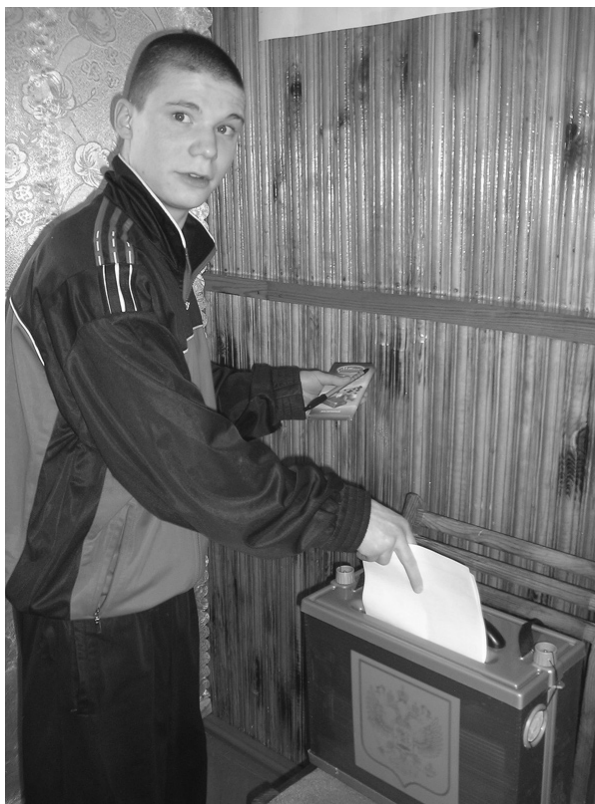
В ПФРСИ при ИК-2 впервые голосующим вместе с бюллетенями вручались шоколад и авторучки