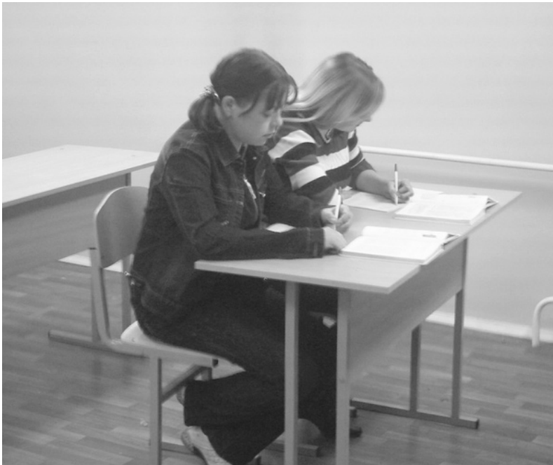
С сентября 2007 года в новом корпусе СИЗО-1 начали функционировать учебные классы.

здесь, а то и в четвертый. Если им дают условный срок, то это совсем не влияет на их поведение — они не воспринимают этой отсрочки. Было немало амнистий, но это тоже не дает результатов, многие и после амнистий снова приходят сюда. Жаль, что процент таких подростков довольно высок. Хотя мы надеемся, что можем им чем-то помочь и настроить их на правильный путь. Несовершеннолетние — это очень сложный контингент. Сегодня они спокойные, могут с вами согласиться, а завтра они уже совсем другие и не помнят о том, что обещали и с чем соглашались. Подростки не устойчивы в своем поведении, за ними постоянно нужен контроль. А у нас их сейчас в пределах ста человек, и за всеми уследить бывает очень тяжело.