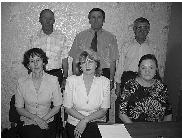
Инженерно-педагогический коллектив ПУ-315

тельность в училище подчиняется достижению единой цели — подготовке обучающихся к успешному вхождению в социально-производственную сферу жизни через овладение необходимыми профессиональными знаниями и умениями. Небольшой коллектив профессионального училища на протяжении многих лет проводит кропотливую работу для создания нормальных условий для профессиональной подготовки осуж-