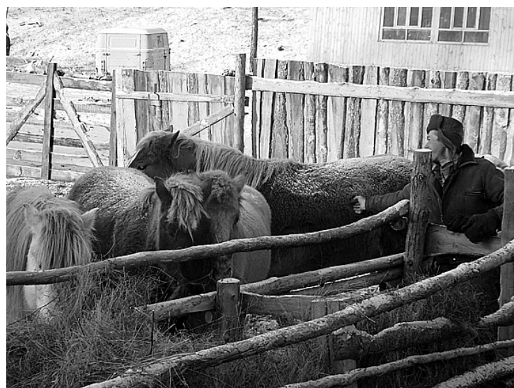
В хозяйстве имеется табун лошадей...

вступая в отношения с человеком, мы должны ему показать, что все, что мы можем дать — жилье, работу и зарплату, не ограничивает его права и свободу. Положительный опыт прибавляет нам сил двигаться дальше. Принося лю-