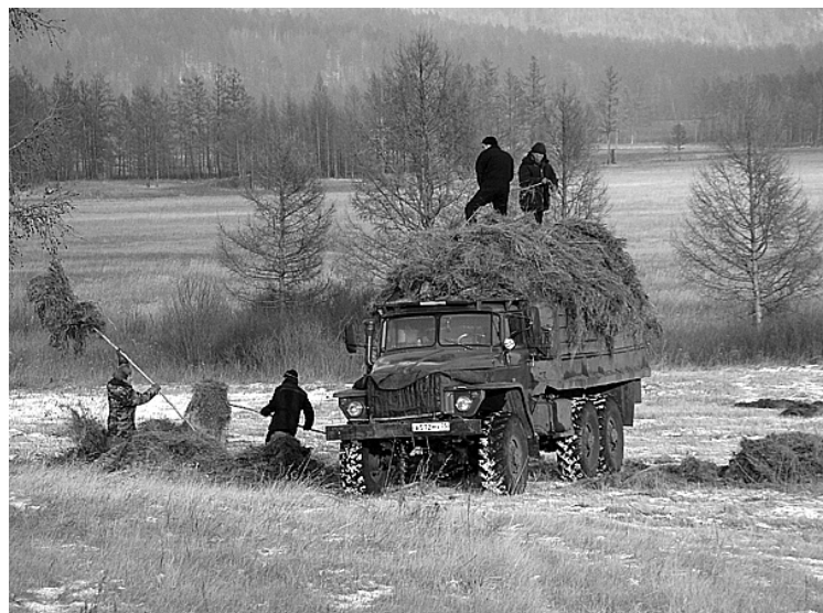
...и корм для скота, и техника