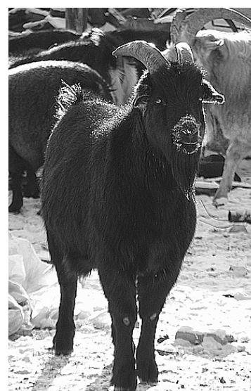
Вожак козьего стада