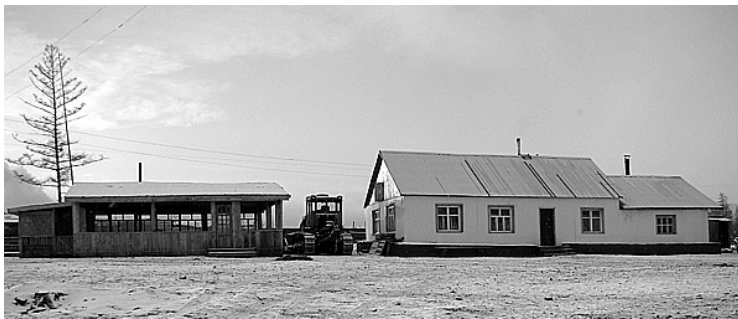
Летняя кухня и столовая

Кроме «лесотерапии», на данный момент, мы можем дать работу и обеспечить жильем от 30 до 40 человек. Чтобы прийти к нам, человек должен твердо знать, чего он хочет. Нам нужны люди, желающие работать и честно зарабатывать свой хлеб.