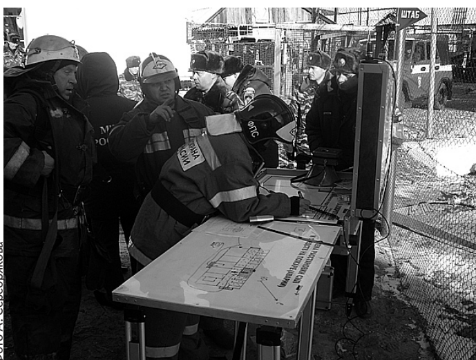
Работа штаба пожаротушения

Уже через три минуты после первого сигнала к месту пожара прибыла пожарная машина с отделением ВПЧ ИК-5 в составе 5 человек. Через 40 секунд был подан ствол первой помощи на ликвидацию очага пожара, установлена трехколенная лестница в окно второго этажа здания терапевтического отделения для эвакуации персонала