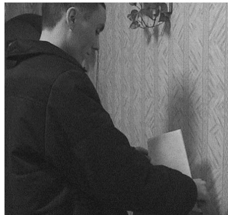
Голосование в помещении, функционирующем в режиме следственного изолятора, при ИК-5