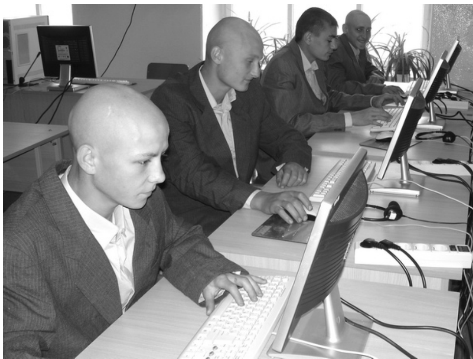
Первоочередная задача УИС - дать воспитанникам образование, обучить профессии, чтобы они потом могли найти место в жизни

явилось ошибкой. Нужно было увозить не только его, но и всю группу, которую он возглавлял. Вы знаете, что у подростков наиболее ярко выражено обязательство между собой, они связаны более жесткими отношениями, чем взрослые. Это при-