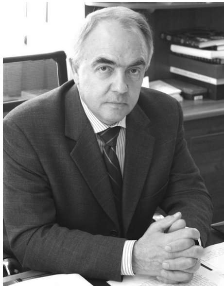
Директор ФСИН России Юрий Калинин вело к массовым беспорядкам.

Калинин: Да, там произошли массовые беспорядки. Они никак не связаны с теми событиями, которые были в "Крестах". К ним привела в том числе ошибка администрации. Там сложилась отрицательная группировка подростков. Администрация решила нейтрализовать ее. И вывели лидера группы за пределы колонии. Что