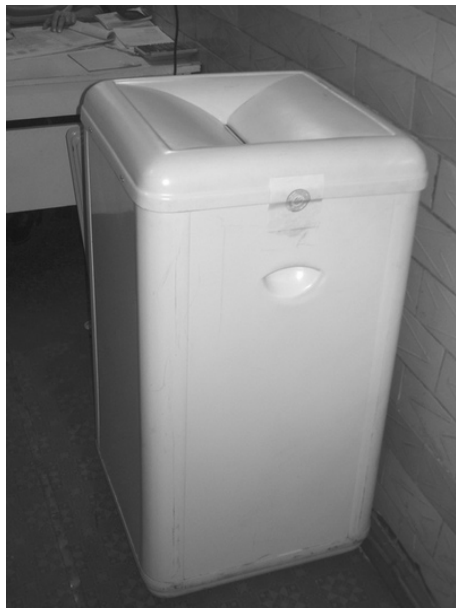
Урна для голосования в помещении следственного изолятора № 1 г. Читы

В ЧИТИНСКОМ следственном изоляторе № 1 голоса распределились следующим образом. За ЛДПР проголосовало 48,4 % следственно арестованных. За «Единую Россию» — 37%. Таким образом, забайкальские сидельцы, как и на двух предыдущих выборах, не изменили своих политических пристрастий и отдали голоса в поддержку Владимира Жириновского и его партии.