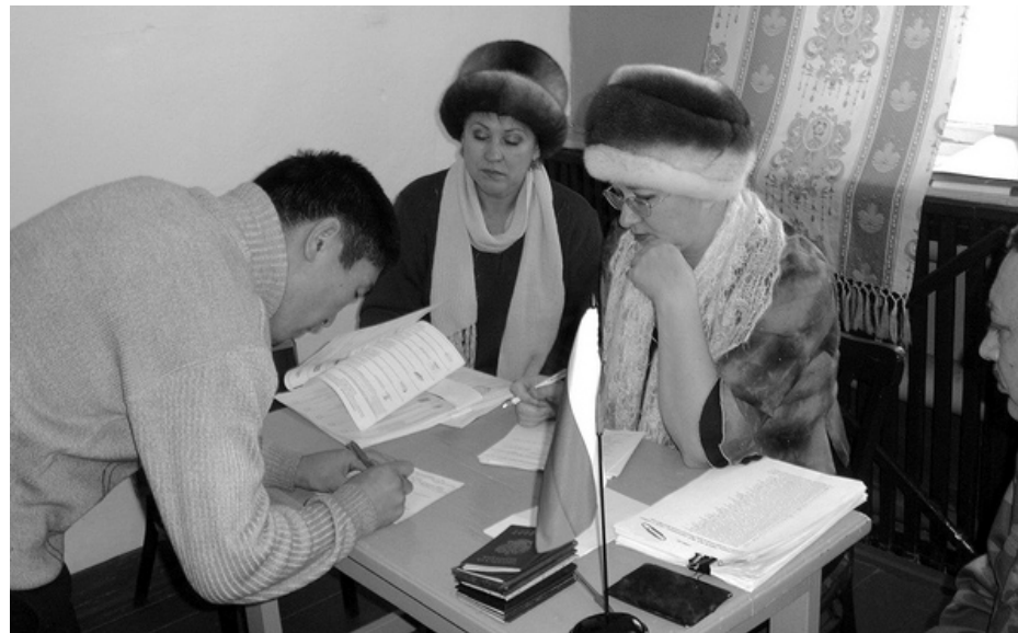
Голосование в исправительной колонии № 3

Остальные партии набрали небольшое количество голосов: КПРФ — 1,3%; «Яблоко» — 0,75%; «Партия социальной справедливости» — 0,28%; «Патриоты России» — 0,93%; «Справедливая Россия» — 1,5%; «Аграрная партия России» — 2,1%; «Союз Правых Сил» — 0,28%; Всероссийская политическая партия «Гражданская Сила» — 1,2%; «Демократическая партия России» — 0,4 %.