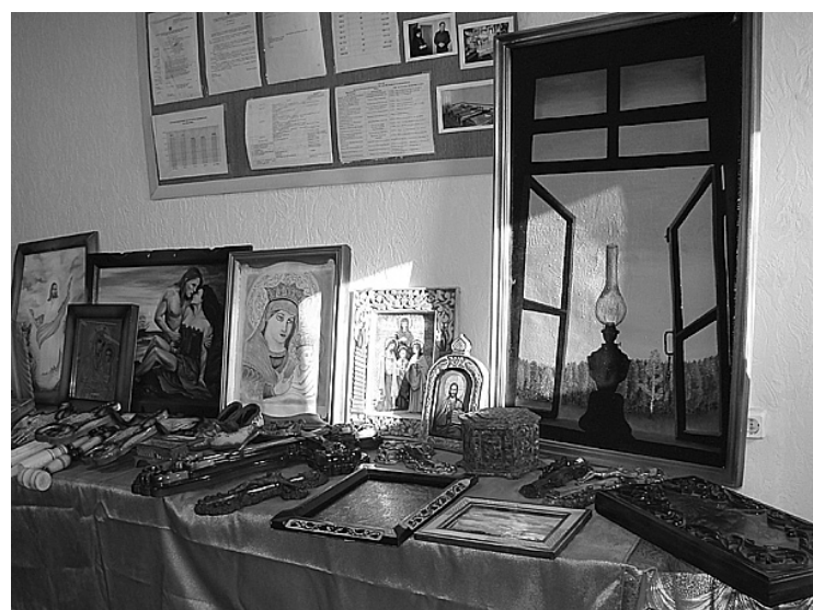
Конкурсные работы. Справа на снимке картина - победитель "Жизнь удалась"