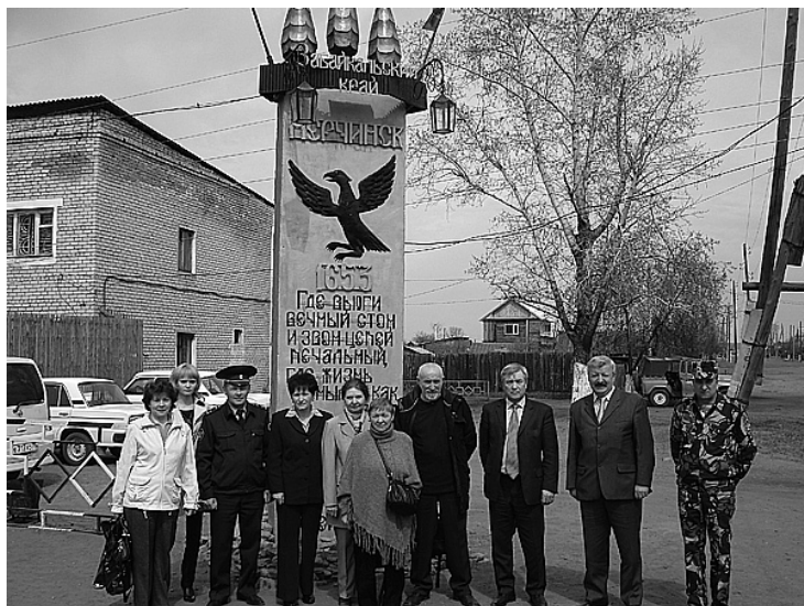
Комиссия по помилованию в ФБУ ИК-1 г. Нерчинска

Помилование является проявлением гуманизма уголовного и уголовно-исполнительного права. Его цель — облегчение участи осужденного в форме его освобождения от дальнейшего отбывания наказания, сокращения срока наказания, замены наказания