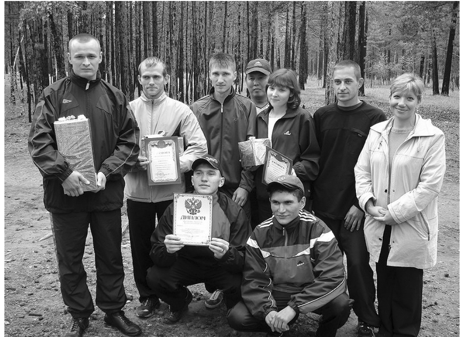
ИК-5 - победитель легкоатлетических соревнований УФСИН 2006 года

Следующий вид легкоатлетических кроссов — 5 тысяч метров. Для его успешного преодоления требует-