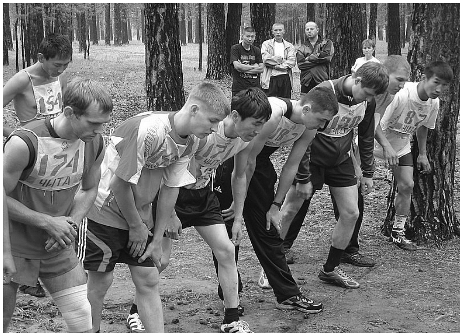
Стайеры - большие тактики. Перед забегом на 5 километров