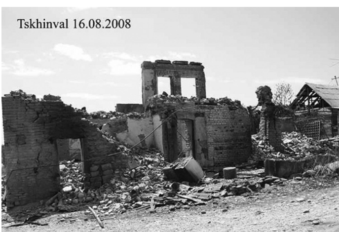
Сегодня многие дома в Цхинвале разрушены до основания. Это результат обстрела из танковых орудий и установок залпового огня "Град"

Р/С 40410810860340000001 БИК 040702660 К/с 30101810600000000660 в Северо-Кавказском банке СБ РФ, г. Ставрополь.