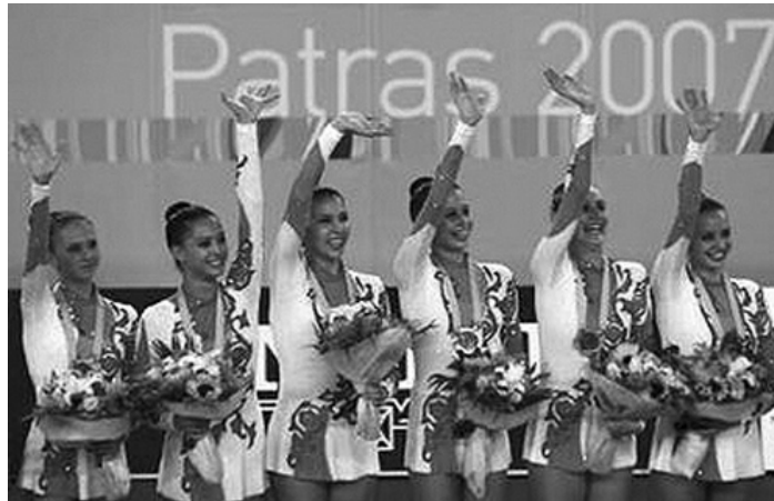
Сборная России по художественной гимнастике