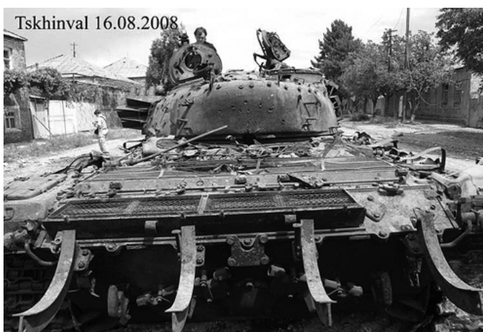
Грузинский танк на улице Цхинвала, подбитый 16-летним осетином. На снимке видна дыра между башней и корпусом от попадания противотанковой гранаты.

Понятно, что комментаторам Би-би-си и Си-эн-эн не нужна правда истории, которая нынешней администрации США помешала довести до победного конца "проект Саакашвили". Он, Запад, не хочет знать, что осетины, живущие на севере от Кавказского хребта, и осетины, живущие на юге от него, являются одним и тем же народом, и что они мирились с их разделением административной границей до тех пор, пока их объединяло общее гражданство в составе СССР. Главным