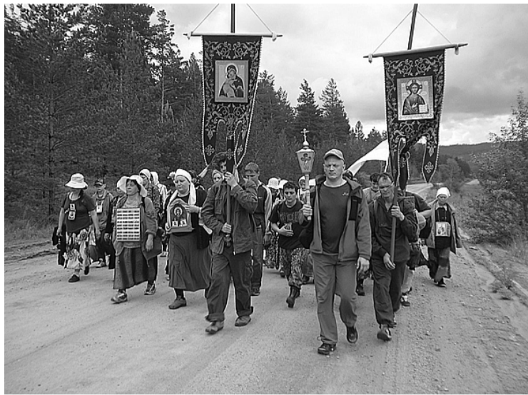
Крестоходцы прошли около 90 километров

И действительно, за два дня, проведенные на озере, ноги «больные, стужёные» без тяжё-