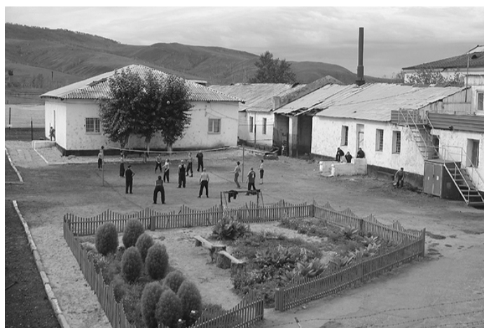
Уютный двор, спортплощадка - кто скажет, что это зона?

В здании, отданном под помещение школы, трудится великолепный педагогический коллектив. Учителя под руководством директора школы Казанцевой Татьяны Николаевны обучают несовершеннолетних осужденных не только школьной программе, но и проводят факультативные занятия, кружки, оказывают помощь администрации учреждения в