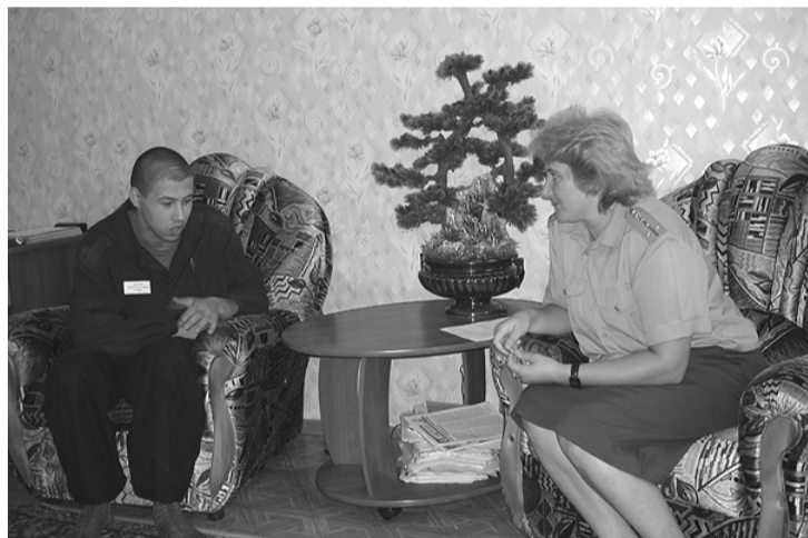
Несовершеннолетний может рассказать о своих проблемах психологу

производственные кабинеты, облагораживают территорию училища, производят ремонт инвентаря, выращивают цветы.