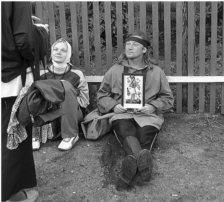
После очередного перехода в пос. Сохондо

Путешествие началось со станции курорта Кука. Вещи были погружены в маленький грузовичок, с собой только котомки с водой и сухарями (кстати, с 23-го начался Петровский пост). А потом — лесные дороги, болота, речки, поля... А тут ещё то дождь, то зной, то шквальный ветер! В первый же день промокли