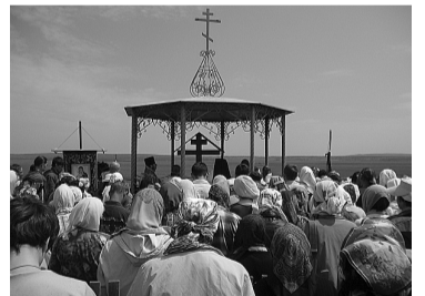
Часовня на озере Иргень

Утром 27 числа, в девятую пятницу Иргень-озеро ожило. Одна за другой подъезжали частные машины. Из деревни, которая также носит название Иргень, шли пешком люди: кто креститься, кто принять участие в молебне, кто купить что-нибудь в развернутой прямо тут же походной иконной лавке. Наконец, из Читы пришла