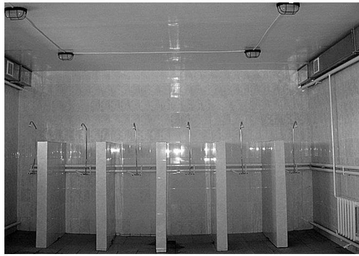
Душевые кабины сверкают новенькой керамической плиткой

В завершении хотелось бы от себя лично и от осуждённых ИК-8 поблагодарить УФСИН России по Забайкальскому краю, администрацию ИК-8 во главе с начальником учреждения майо-